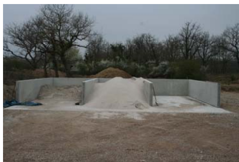
Nouveaux bacs à sable

De nombreux travaux ont été faits sur le parcours (aménagement de chemin, plantations d'arbres, bacs pour le sable, etc..)