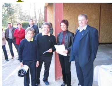
Vainqueurs en Brut Ryder cup

Ce réaménagement à bas coût, nous permet de ne plus avoir à louer des tentes pour organiser nos réceptions. Merci à toutes les personnes qui ont participé à ce projet.