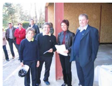
Brutto-Sieger Ryder Cup